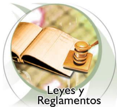
Leyes y Reglamentos

Como ya se mencionó con anterioridad, es de suma importancia que conozcas lo establecido en el reglamento del recurso de inconformidad así como las leyes del IMSS, pues en él se explica cómo se realiza el proceso desde el formato del documento, la presentación de pruebas hasta la resolución.